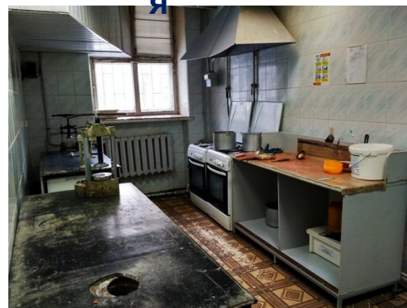
Формовочная и полимеризационная