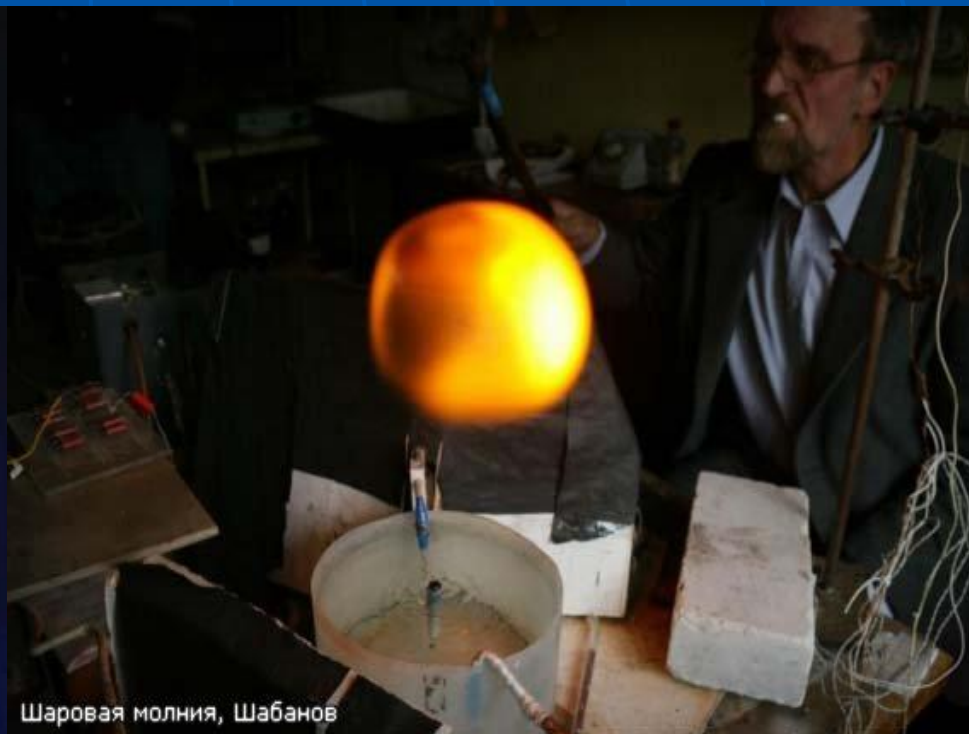
Шаровая молния, Шабанов