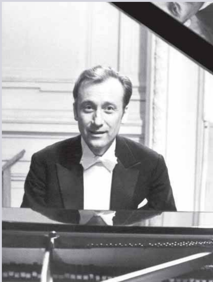
Большой зал Консерватории. Премьера Второго концерта для фортепиано с оркестром. Солист – автор. 1966г.

В 60-е годы Щедрин создал самое исполняемое свое сочинение — балет "Кармен-сюита", впервые обратился к опере ("Не только любовь"), начал серию произведений в жанре, которому он придал новый смысл, — концерты для оркестра ("Озорные частушки" и "Звоны"), сочинил две крупные оратории ("Поэтория" и "Ленин в сердце народном") и самое масштабное свое произведение для фортепиано соло — 24 прелюдии и фуги, осуществил смелый стилистический синтез во втором концерте для фортепиано. Параллельно он выступал как пианист, преподавал в Московской консерватории, но в 1969г. прекратил там свою работу, войдя в конфликт с партийными деятелями теоретико-композиторского факультета.