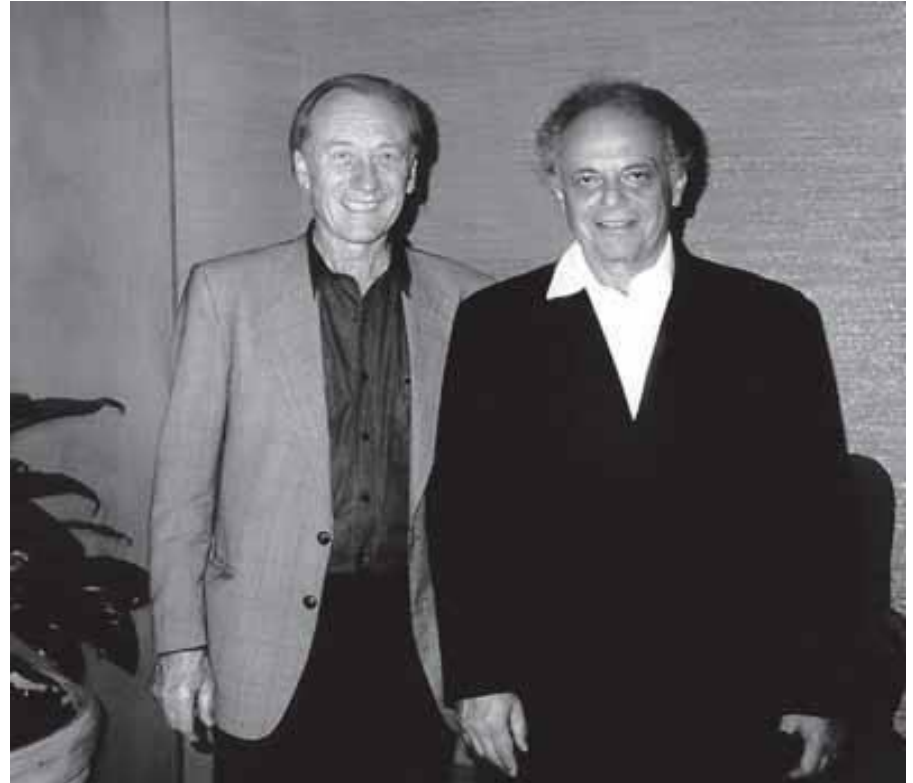
С дирижером Лорином Маазелем после премьеры 3-го концерта для оркестра «Старинная музыка российских провинциальных цирков». Чикаго 1990г.

В Японии был поставлен мюзикл Щедрина "Нина и 12 месяцев" (1988) и исполнены "Хороводы" (Четвертый концерт для оркестра, 1989), к 100-летию Чикагского симфонического оркестра написана "Старинная музыка российских провинциальных цирков" (Третий концерт для оркестра, 1989), сочинены камерные пьесы для Финляндии и Парижа.