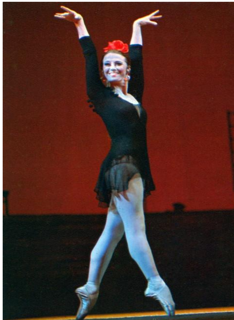
Народная артистка СССР, лауреат Ленинской премии Плисецкая М.М. в роли Кармен. Балет Ж. Бизе - Р.К. Щедрина "Кармен - сюита". ГАБТ, 1976

Внешне балет возник как результат экстренной помощи композитора своей супруге, когда она зажглась неодолимым желанием воплотить образ Кармен в хореографии кубинского балетмейстера А. Алонсо. За 20 дней Щедрин создал свою знаменитую транскрипцию номеров из оперы Ж. Бизе "Кармен", используя не симфонический оркестр, а струнные и 47 ударных инструментов, достигнув свежей современной звуковой окраски.