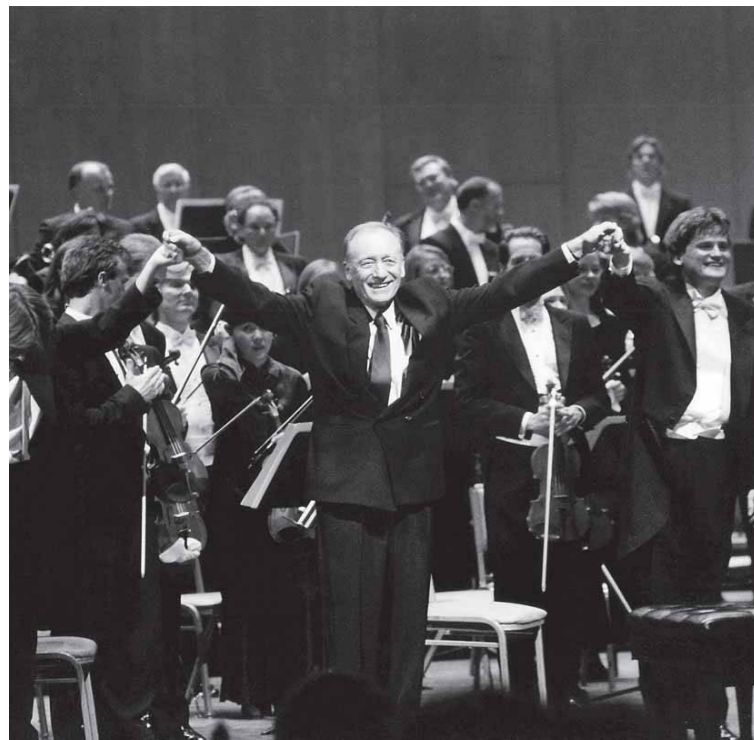
После премьеры 5-го фортепианного концерта. Солист Олле Мустонен. Лос-Анжелес 1999г.

70-летие композитора в 2002 году было отмечено великолепным фестивалем в Москве и Петербурге