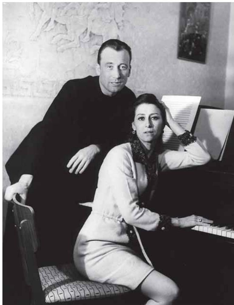
Щедрин и Плисецкая у себя дома.