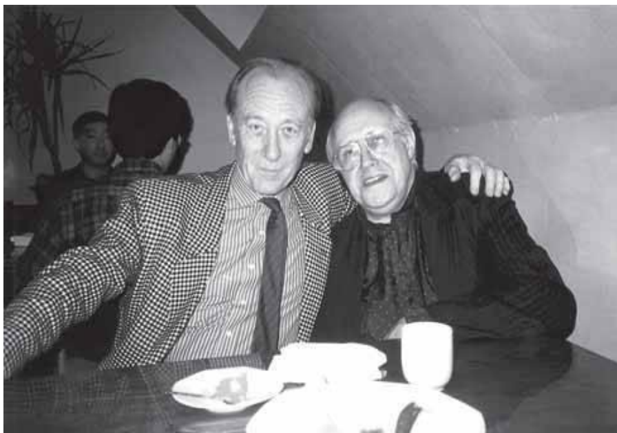
Щедрин и М.Растропович

Наступившая в 1985 году горбачевская перестройка, открыла возможности контактов с зарубежными странами. В 1988 году состоялся советско-американский фестиваль "Делаем музыку вместе". В штат Массачусетс прибыло около 300 человек. Мировой резонанс фестиваля, и художественный, и политический, был громадный. Волна перестройки повлекла людей, столь активных, как Щедрин, и к хождению во власть. Композитор стал и действенным политиком. В 1989 году от Союза композиторов он был избран в Верховный Совет СССР. Кроме того, он вошел в известную Межрегиональную группу народных депутатов за перестройку в СССР.