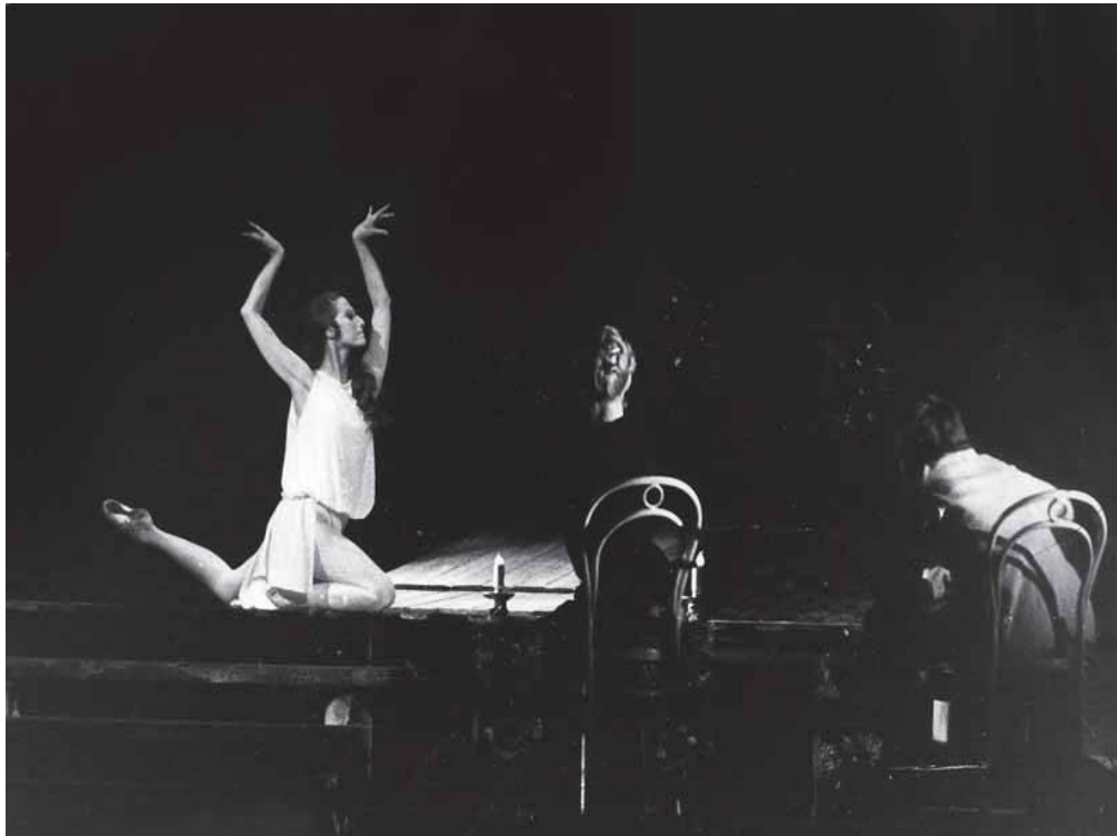
М.Плисецкая в балете «Чайка». Большой театр

В 1973 году Щедрин избирается на важный руководящий пост — председателя Союза композиторов Российской Федерации. Композитор пишет десятки литературных работ, он создает либретто для своих сценических произведений - опера "Мертвые души" по Н. Гоголю (1976, постановка — 1977). Продолжается его сотрудничество с М. Плисецкой: ей посвящаются балеты "Анна Каренина", "Чайка" и "Дама с собачкой».