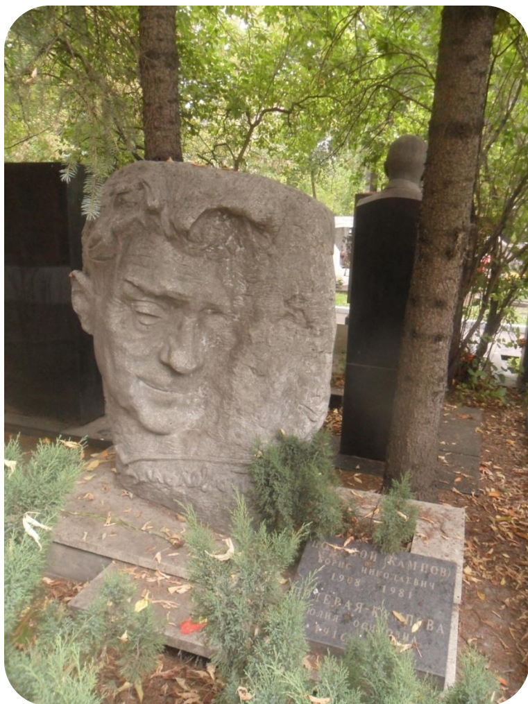
Могила Б.Н. Полевого на Новодевичьем кладбище Москвы