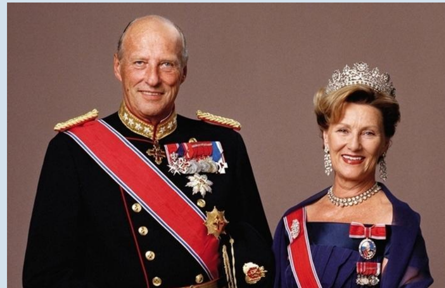
Король и королева Норвегии (Харальд V и Соня Харальдсен)