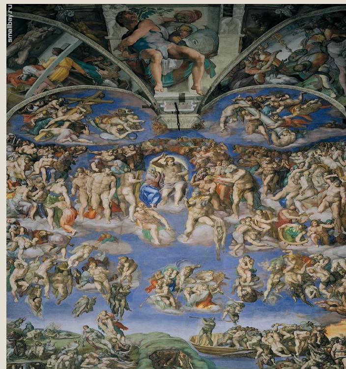
Фреска в Соборе святого Петра