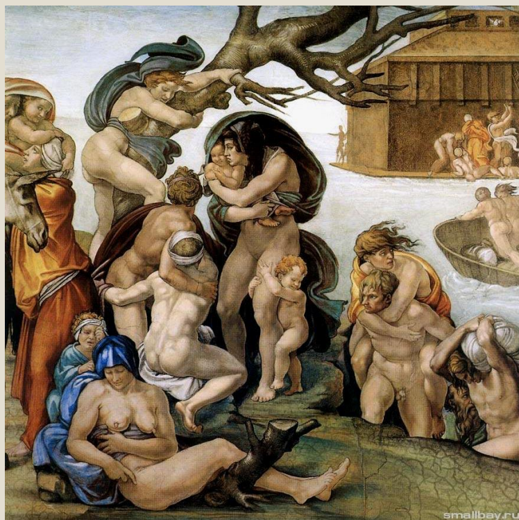
Потоп, фрагмент росписи