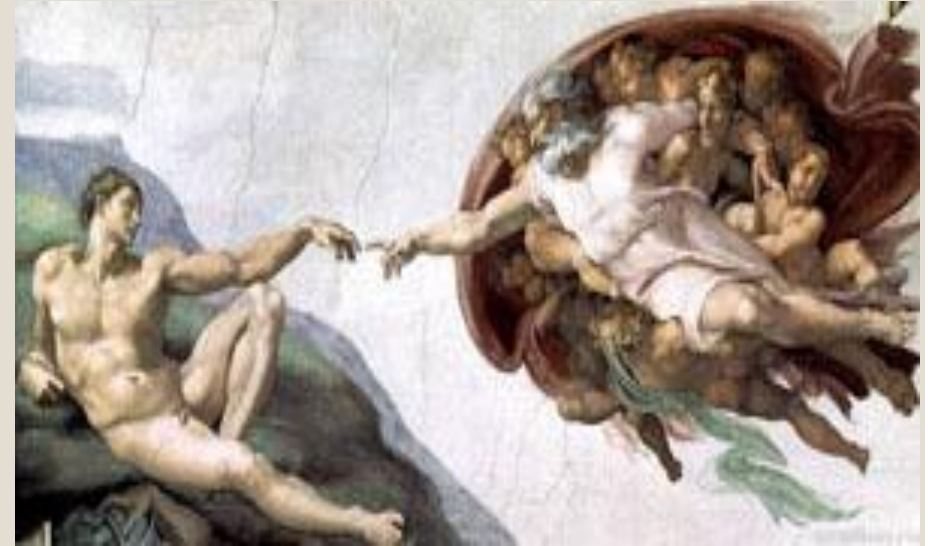
Деталь росписи: Сотворение Адама