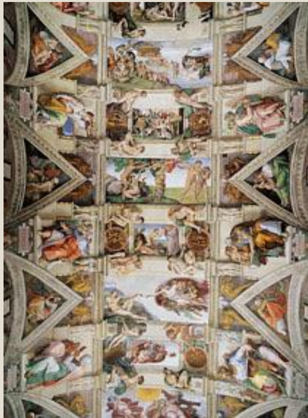
Фреска «Страшный Суд»