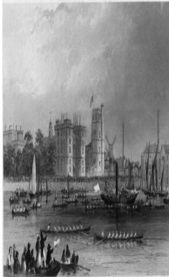
Grand Match between Oxford and Cambridge April 14, 1856 London Illustrated News, 1856