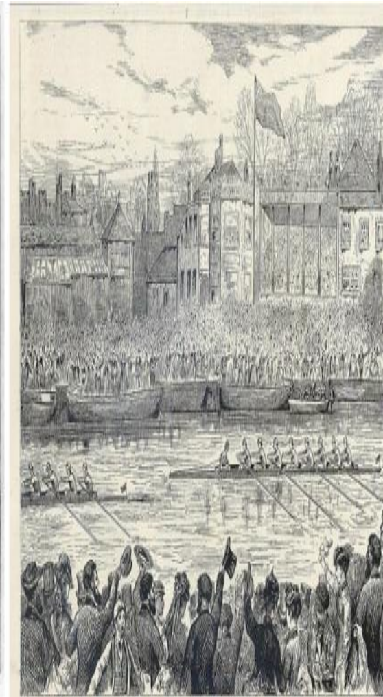
THE OXFORD AND CAMBRIDGE BOAT RACE—THE FINISH