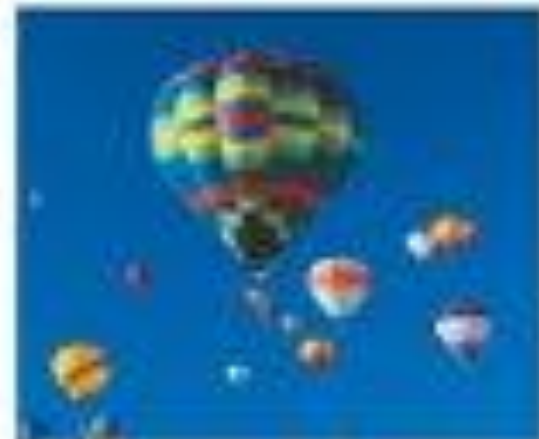
Мал. 34. Фізичні явища