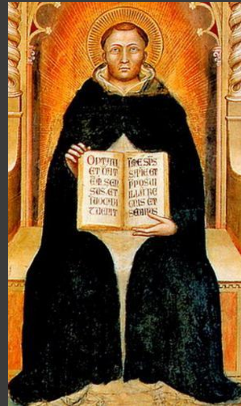
Фома Аквинский 1221-1274