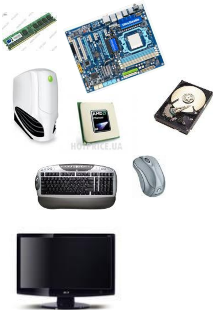
Отдельные объекты (устройства)