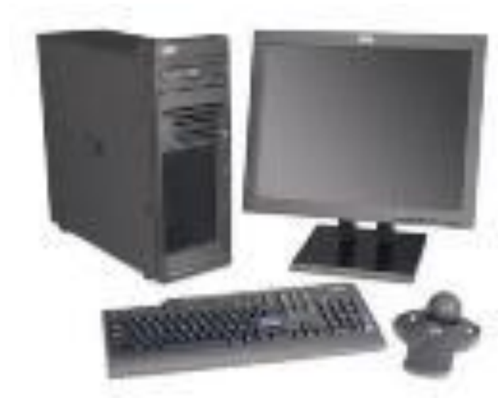
целостная система (компьютер)