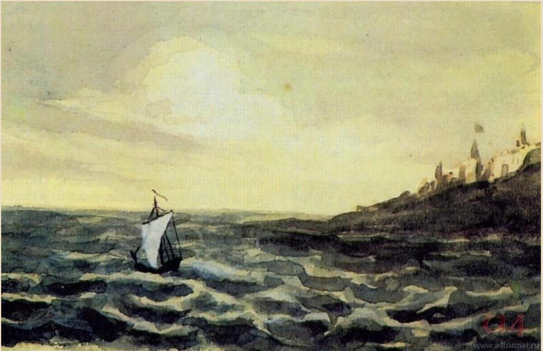
М.Ю.Лермонтов. Морской пейзаж с парусной лодкой.1828-1831.