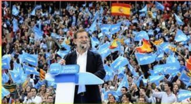
Мариано Рахой, НП