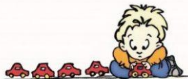
Выстраивает предметы в линейку