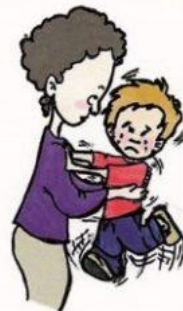
Не любит прикосновений