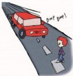
Не осознает опасных ситуаций