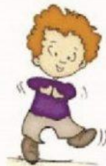
Гиперактивен или наоборот пассивен