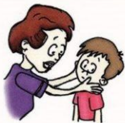
Не смотрит в глаза