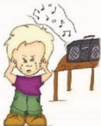
Чувствителен к некоторым звукам