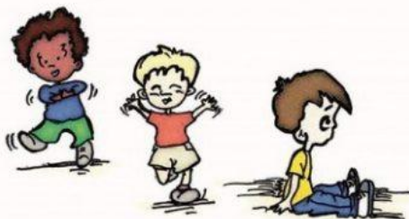
Не интересуется детьми