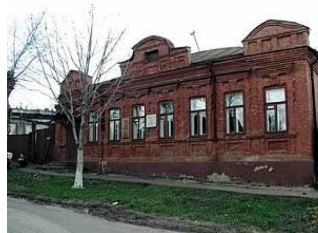
Дом Буниных в Ефремове