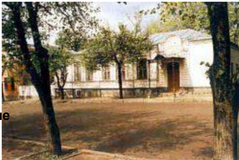
Музей И.А. Бунина в Орле