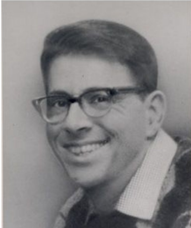
Уриель Вайнрайх (1926 – 1967)