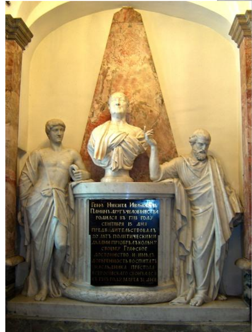
Надгробок Н. І. Паніна