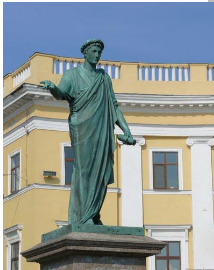
Пам'ятник герцогу де Рішельє в Одесі.