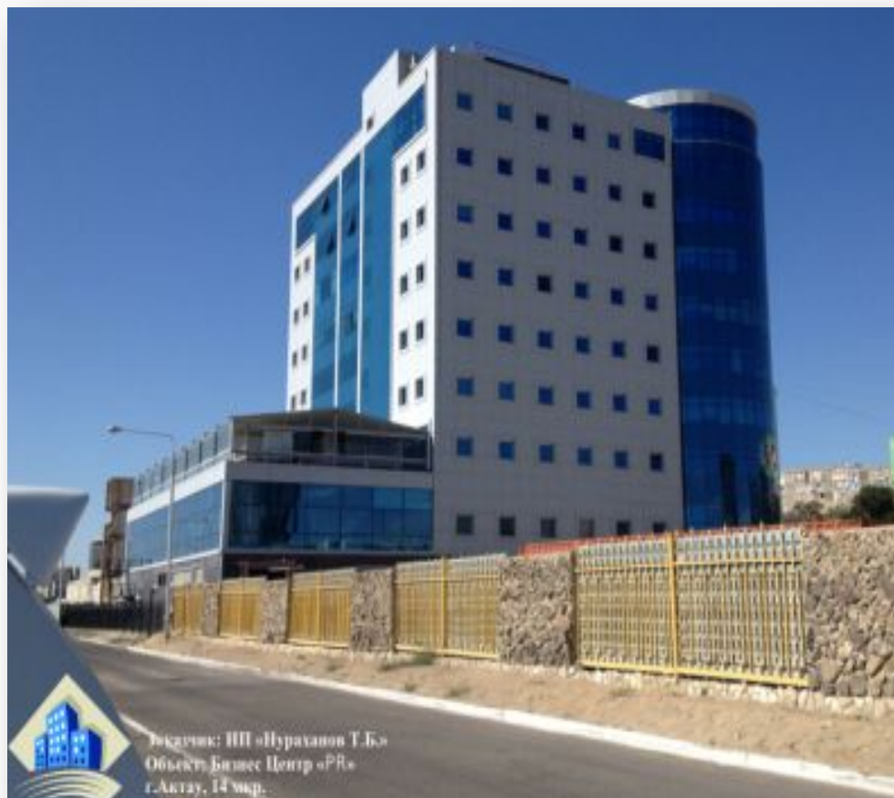
Бизнес комплекс «PR», 14 мкр.