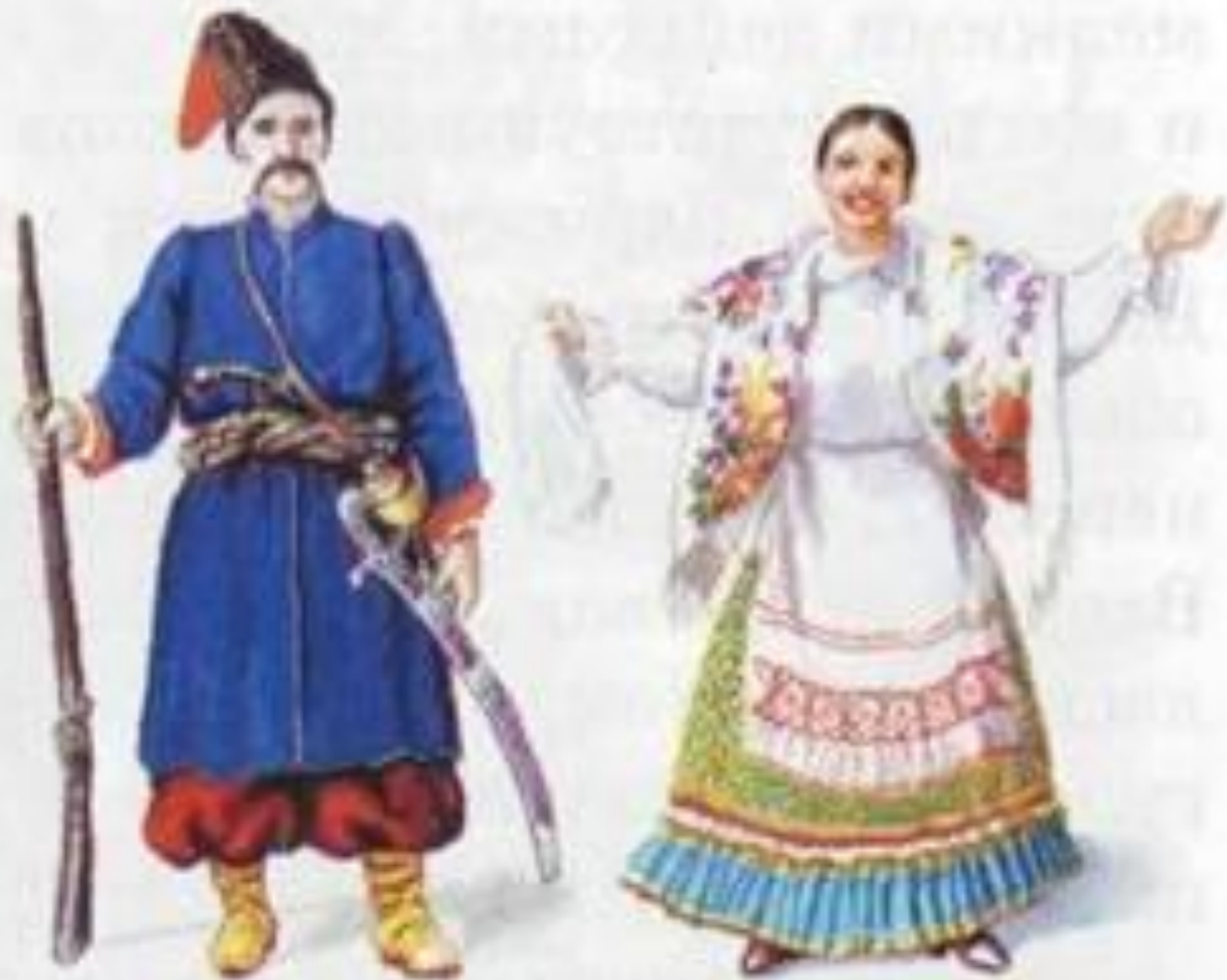
Казак и казачка. Начало XIX в.