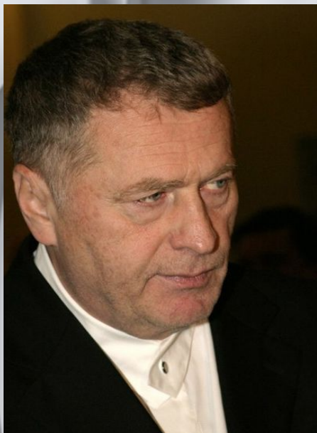
Владимир Вольфович Жириновский

Радикальная партия, выступающая за сильное государство, которому должны быть подчинены интересы всех его граждан.