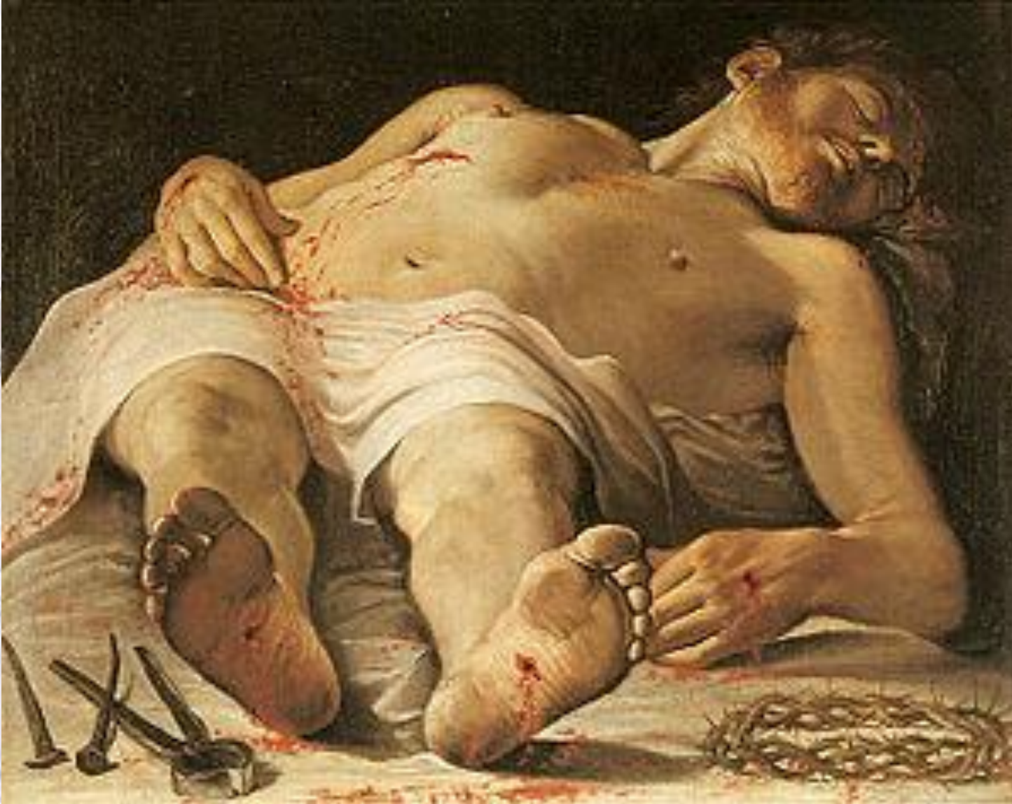
«Мёртвый Христос с орудиями страстей» картина Аннибале Карраччи