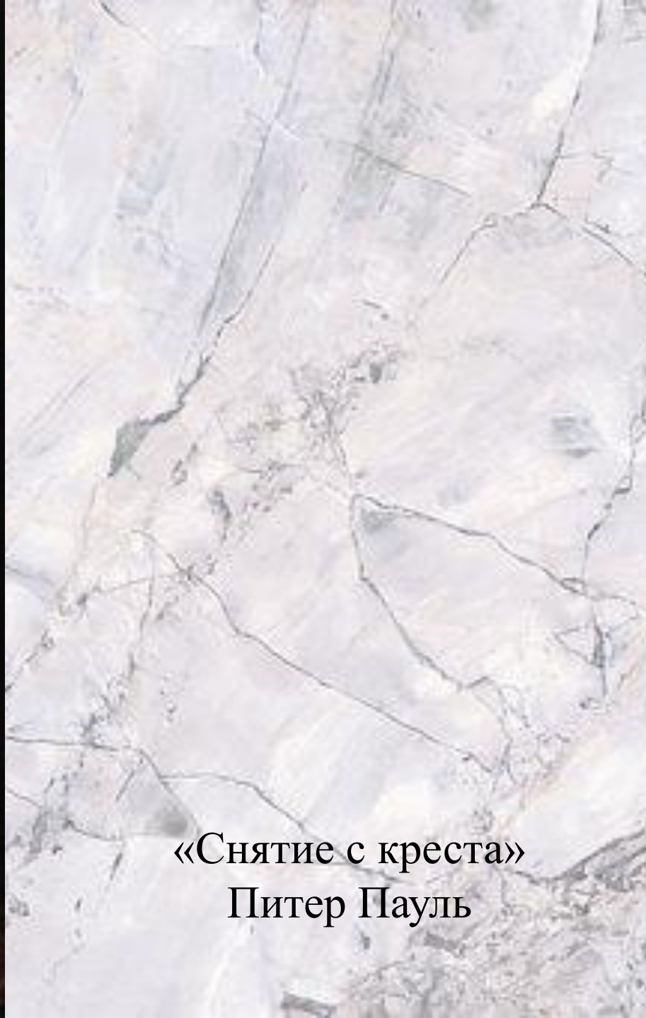
«Снятие с креста» Питер Пауль