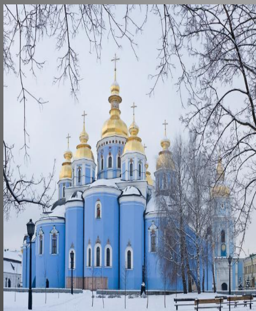
Храм Святого Миколая.