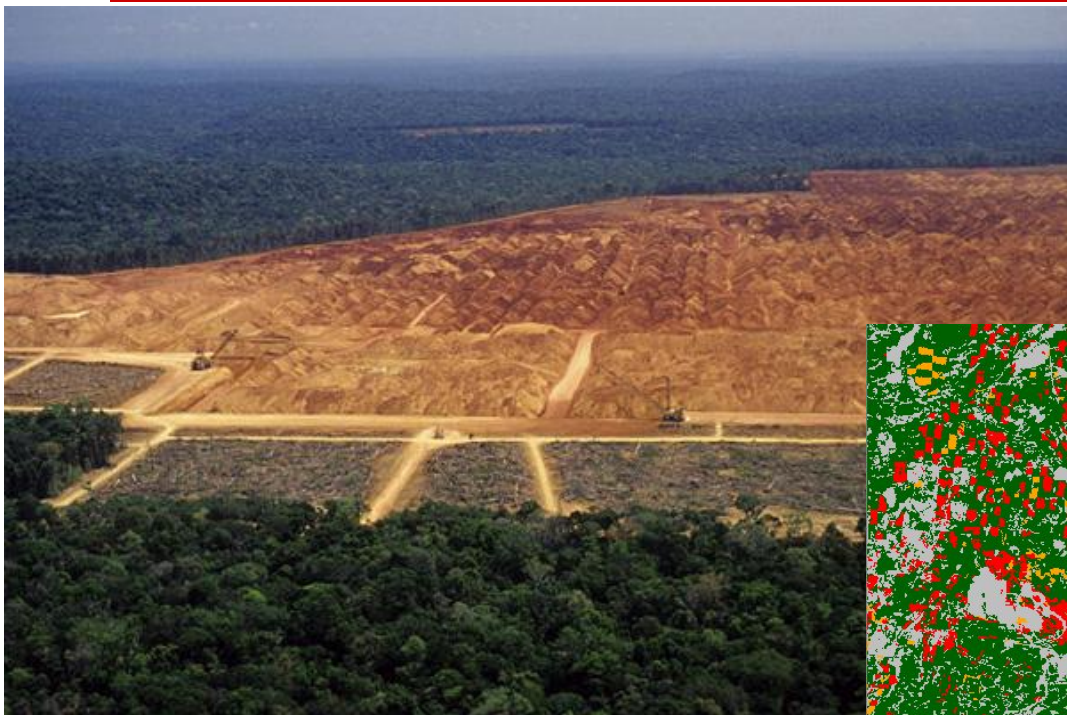
Вырубка тропических лесов- «лёгких» планеты