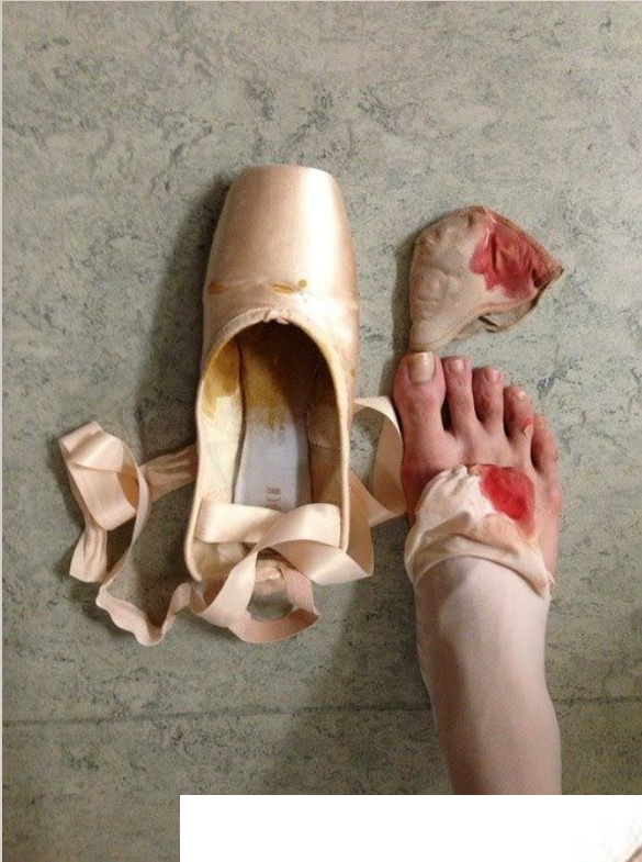
Вальгусная деформация большого пальца стопы