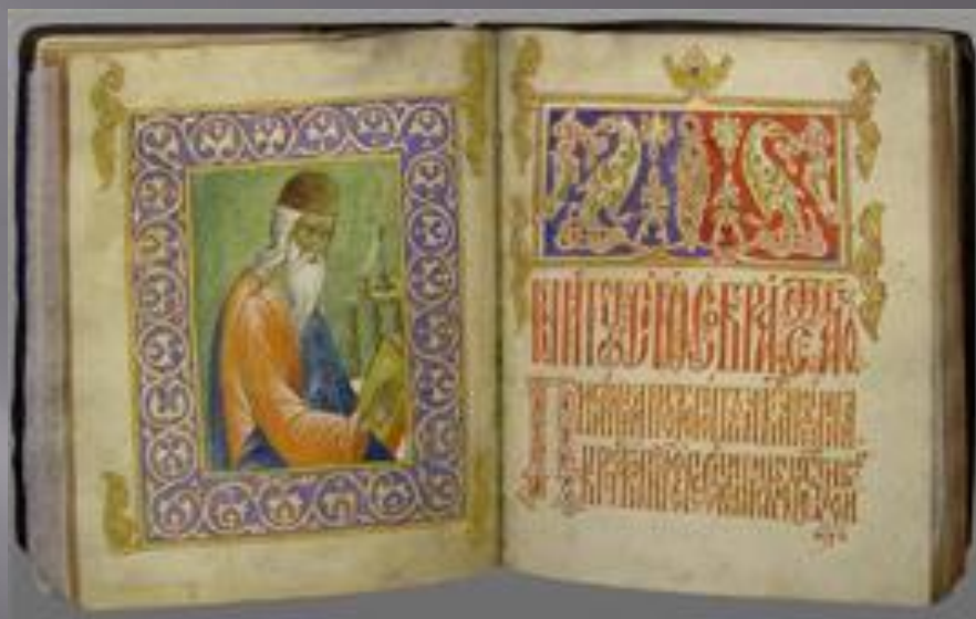
«Житие Протопопа Аввакума писаное им самим»