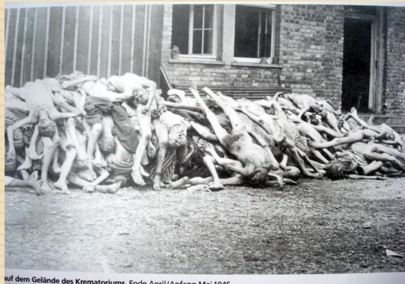
auf dem Gelände des Krematoriums. Ende April/Anfang Mai 1945