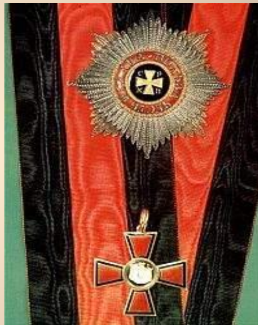
1917г. Орден Святого Владимира IV ст.