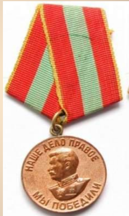
1946г. Медаль «За доблестный труд в Великой Отечественной войне 1941—1945 гг.»