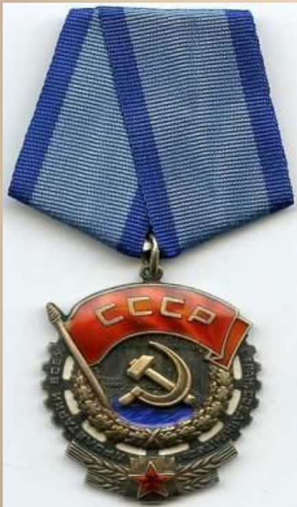
1939г. Орден Трудового Красного Знамени.