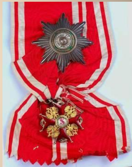
1916г. Орден Святого Станислава II ст.