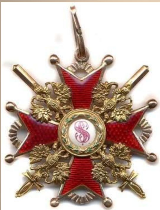
1915 г. Орден Святого Станислава III ст.