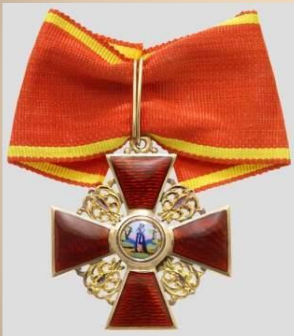
1916 г. Орден Святой Анны IV ст.