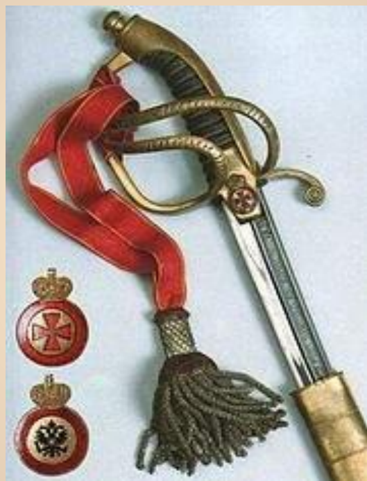
1916 г. Орден Святой Анны IV ст.