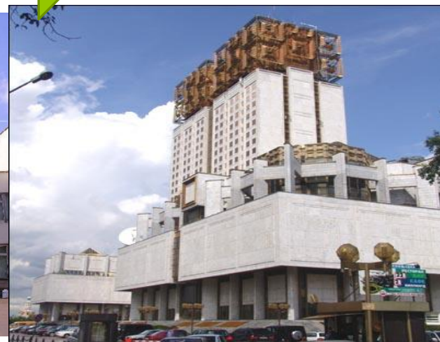
Институт славяноведения РАН

54 вуза Европейской части России и Урала, главным образом педагогического профиля.