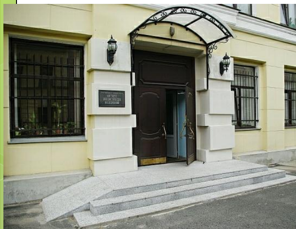
Институт лингвистических исследований