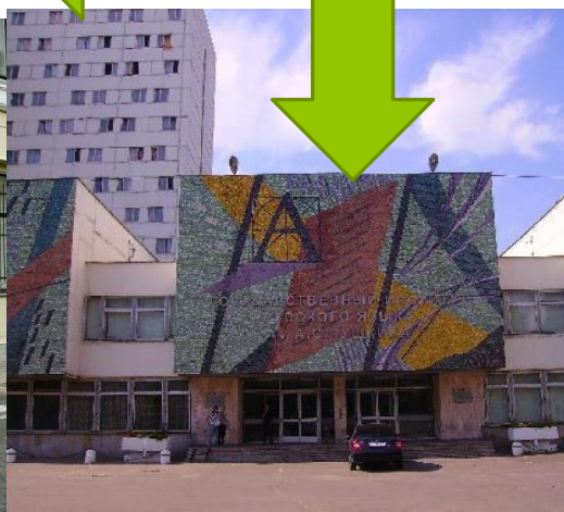
Институт русского языка