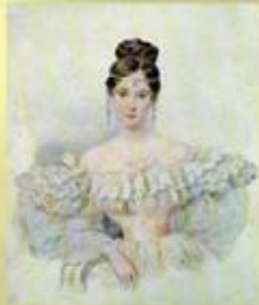
Наталья Гончарова жена А. С. Пушкина. и мать его 4 детей