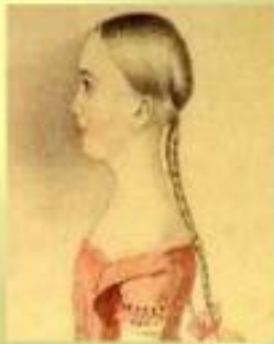
Старшая дочь Мария Александровна Пушкина (1832-1919г.)