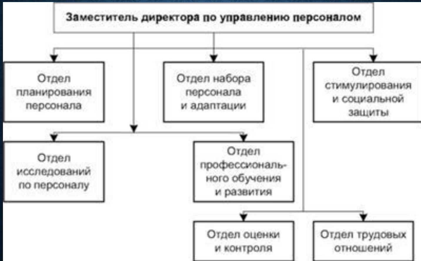
СХЕМА УПРАВЛЕНИЯ ПЕРСОНАЛОМ