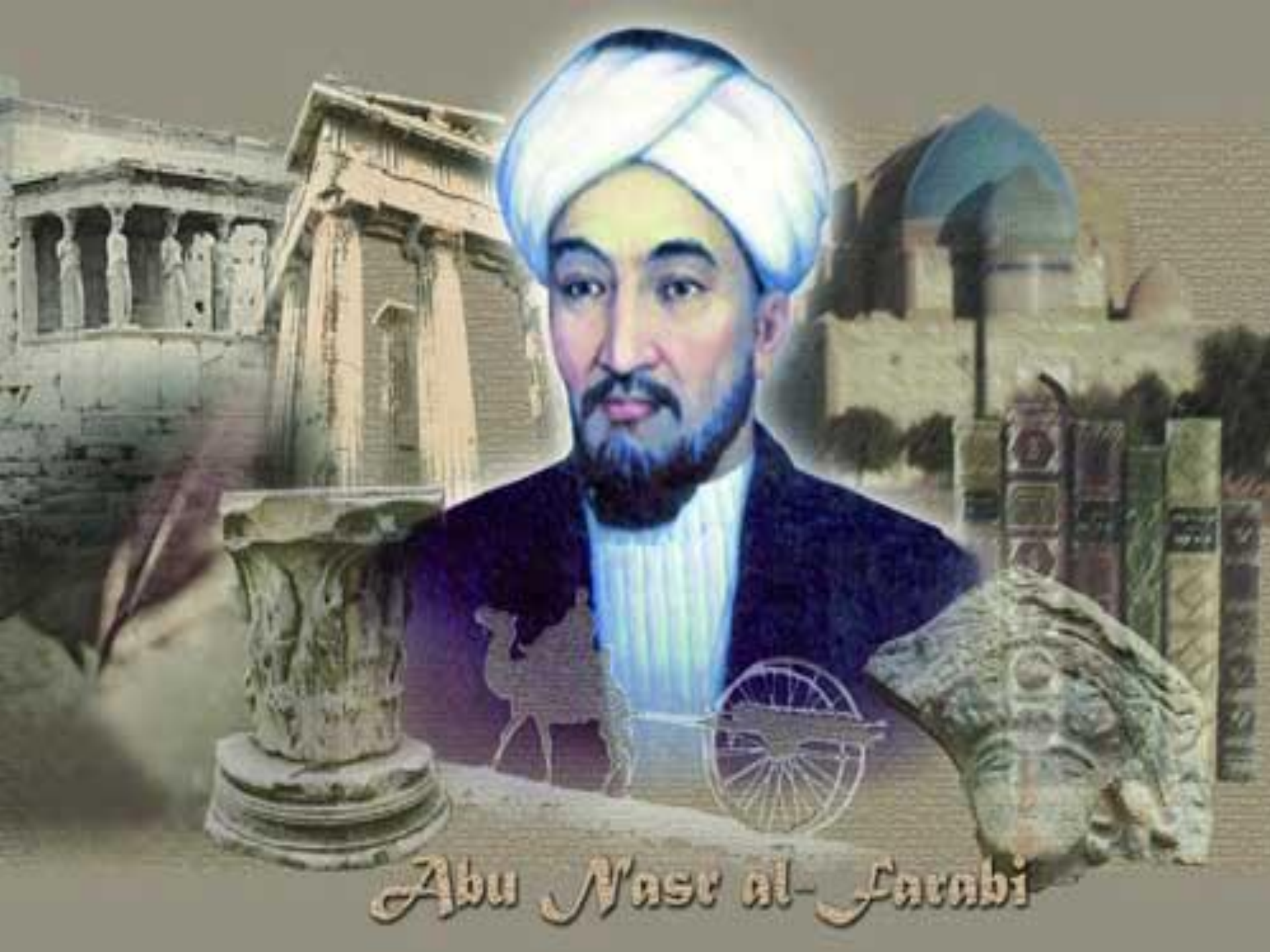
Abu Nasr al-Farabi