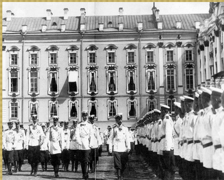
Служба в Гусарском полку в Царском селе.

Во время кавказской ссылки творчество Лермонтова только расцветает: кроме литературы он занимается еще живописью. Благодаря ходатайствам бабушки возвращается в Петербург, восстанавливается на службе.