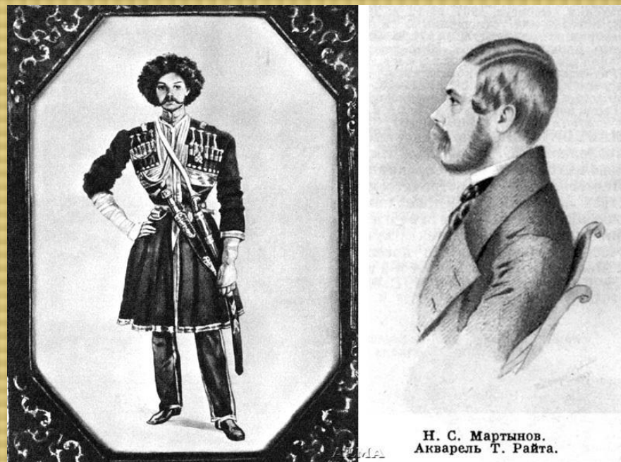
Старый товарищ Мартынов Н.С.

В Пятигорске, возвращаясь со второй ссылки, Лермонтов встретил старого товарища Мартынова. Тот, оскорбившись на злую шутку поэта, вызывает Лермонтова на дуэль. 15 (27) июля 1841 года на этой дуэли Лермонтова настигла смерть.