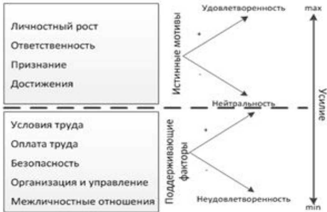
Рисунок 1. Влияние поддерживающих факторов и истинных мотивов на работу сотрудника