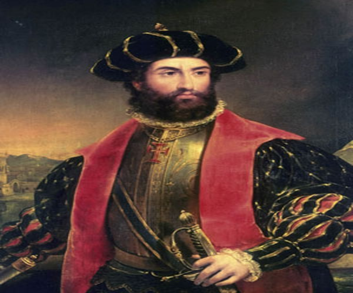
□ Васко да Гамма