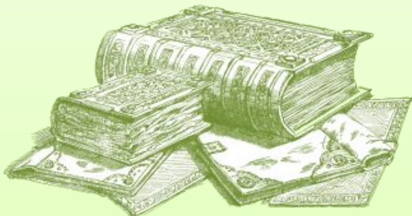
1. Жалпы мәлімет