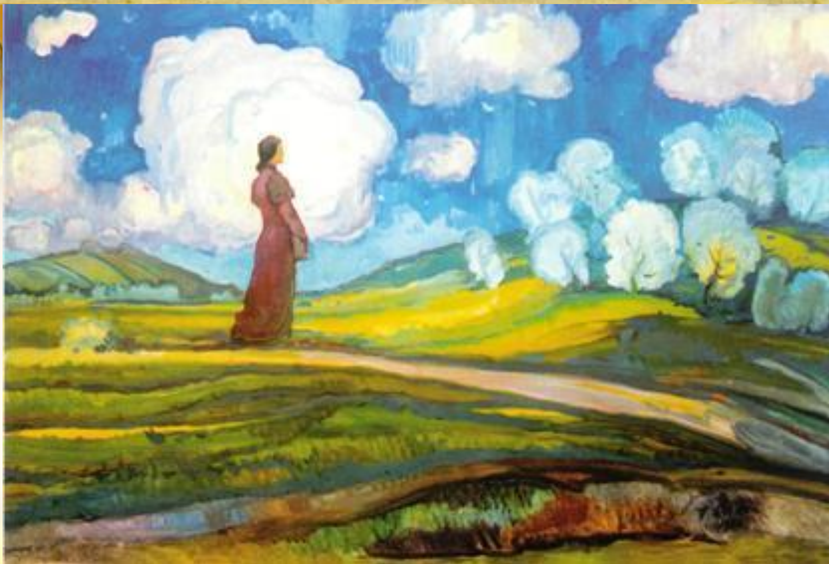
Балла Павло Карлович «Стояла я і слухала весну...»