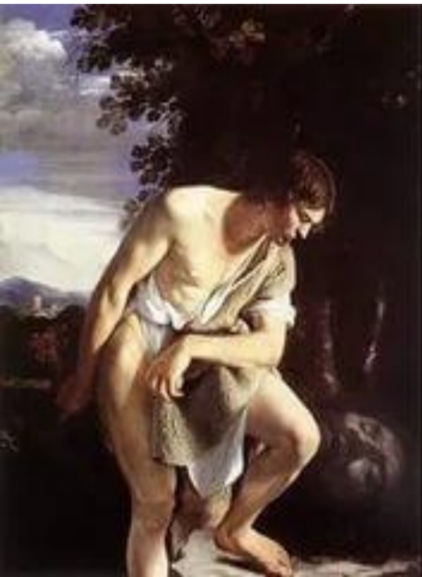
О. Джантилески. Давид с головой Голиафа.