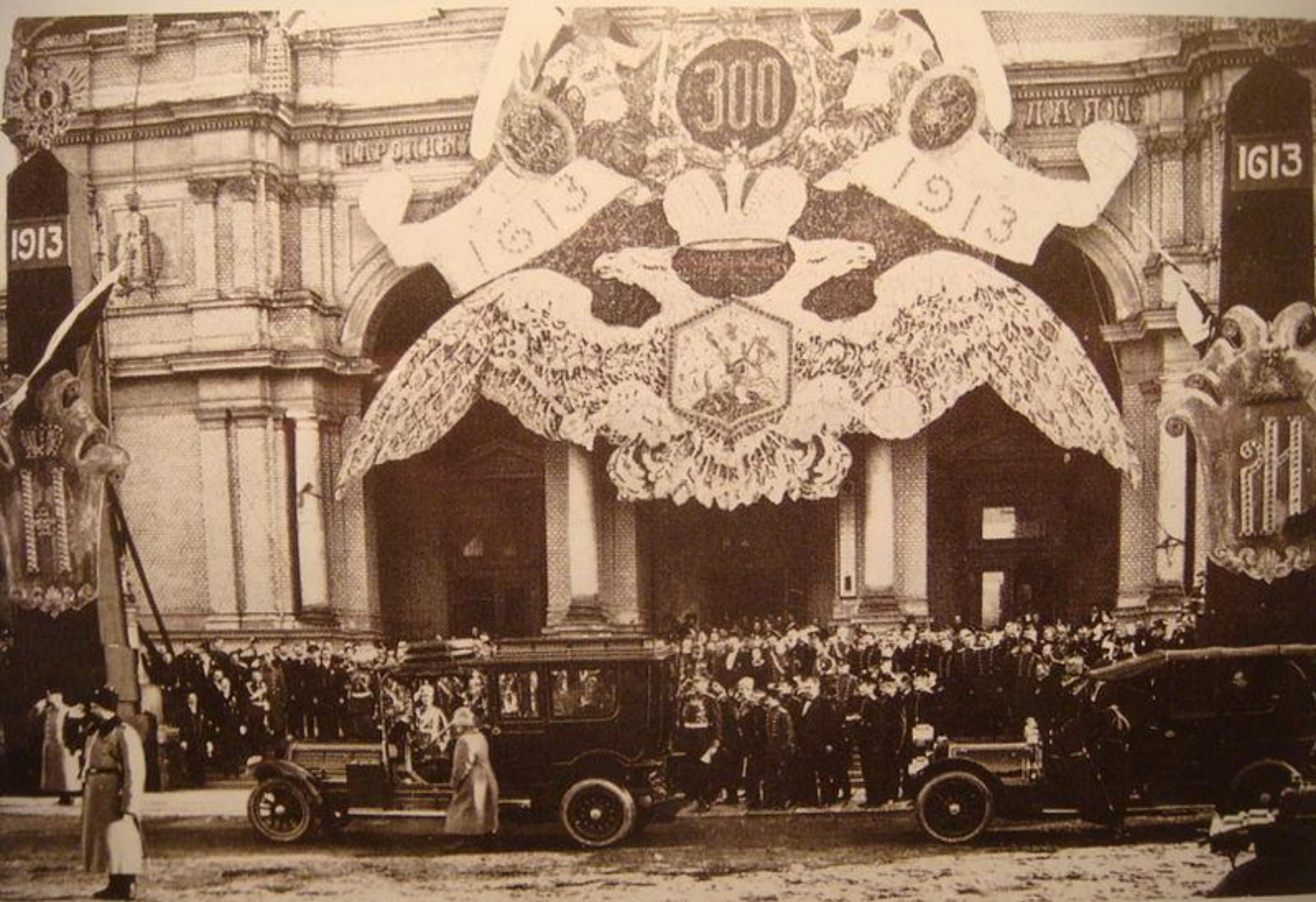
During the 300th-anniversary celebrations Nicholas II dedicates "The house of the People" which he has found