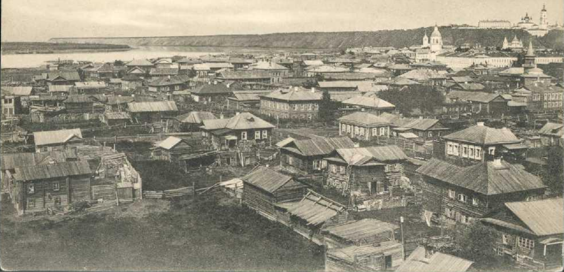
Тобольскъ, Общій видъ города