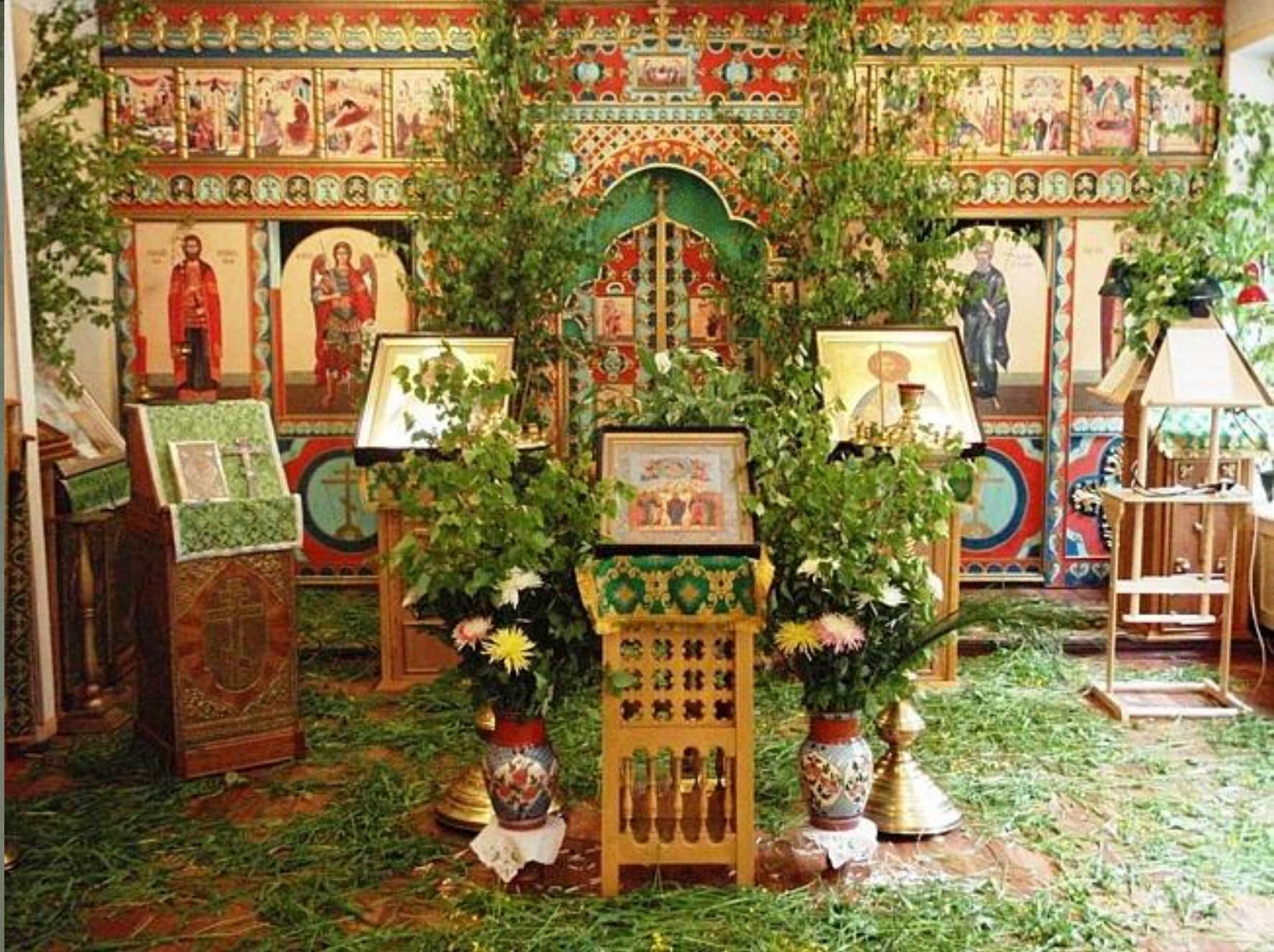
В Церкви на Троицу