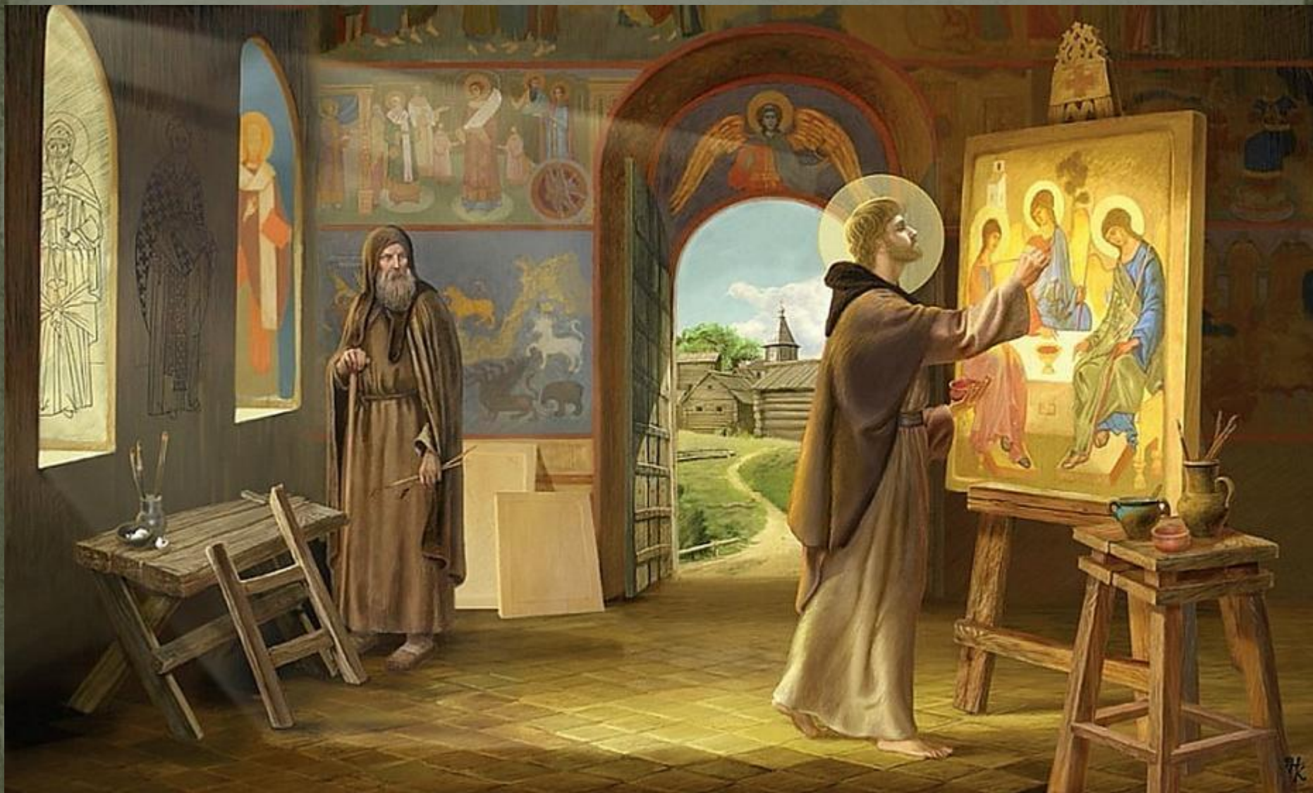
Преподобный Андрей Рублев