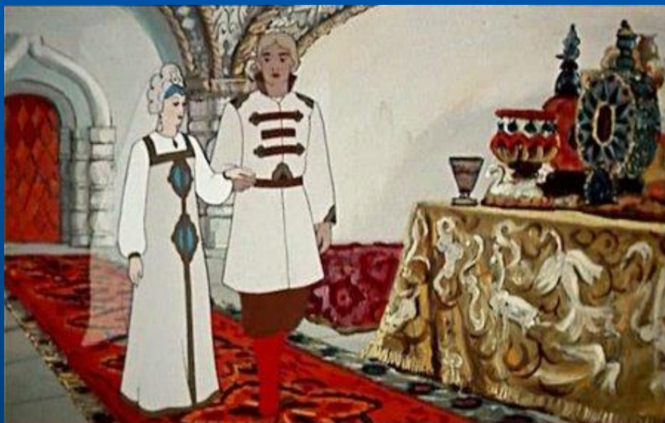
Сказка о МЕРТВОЙ ЦАРЕВНЕ И СЕМИ БОГАТЫРЯХ