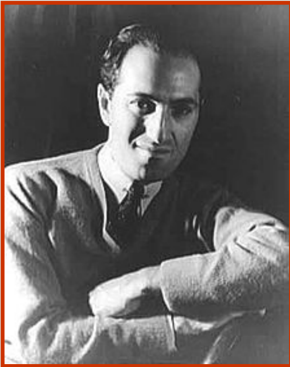
Джордж Гершвин (1898 – 1937)