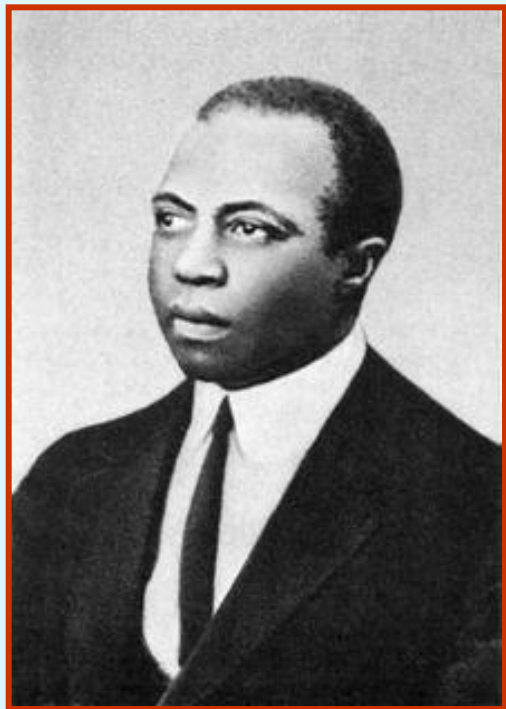
Скотт Джоуплин (1868 – 1917)