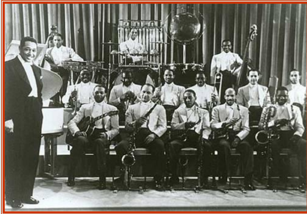
Оркестр Дюка Эллингтона