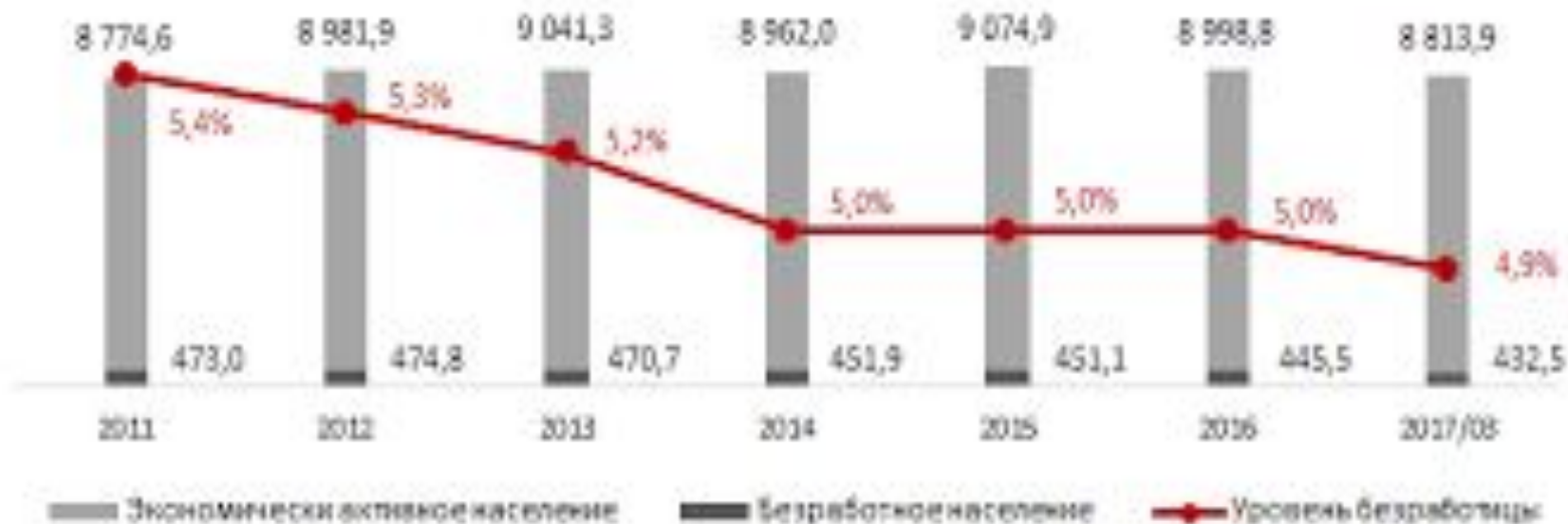
Основные индикаторы рынка труда (тыс. чел.)

Расчеты Ranking.kz на основе данных АС ММЭ РТ