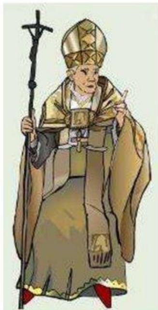
Папа Лев IX