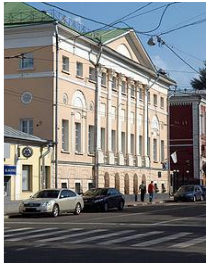
Здание, в котором расположен центральный офис партии

«Яблоко» возникло и развивалось в русле демократического движения как альянс политических групп, представлявших различные идеологические течения — либералов. В процессе формирования партии необходимо было определиться с тем, какую «нишу» в партийно-политическом спектре она займёт — станет ли она в конечном итоге социал-демократической или либеральной партией. Нужно было также решить, какая именно формула либерализма может наиболее точно выразить её идейное кредо. Решающим фактором, повлиявшим на такое решение, стало отношение к происходящим изменениям в стране.