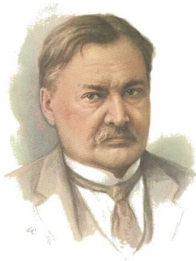
ГЛАЗУНОВ Александр Константинович (1865-1936)