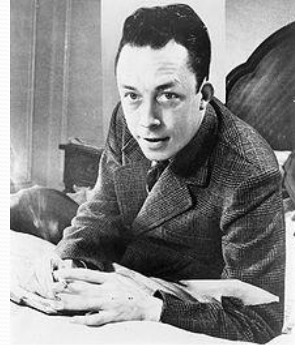
Альбер Камю 1913-1960