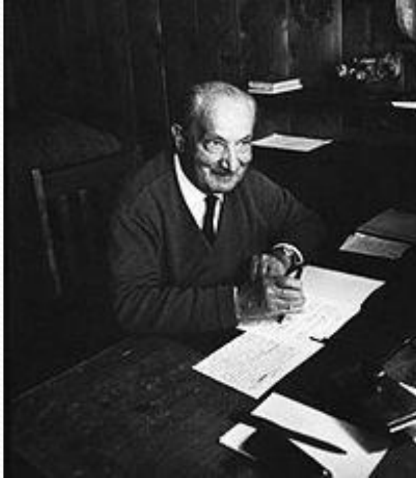
Мартин Хайдеггер 1889-1976