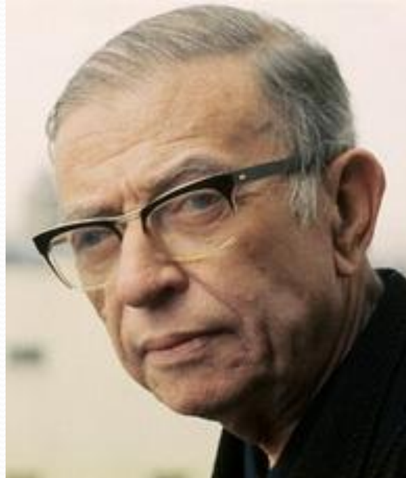
Жан Поль Сартр 1905-1980