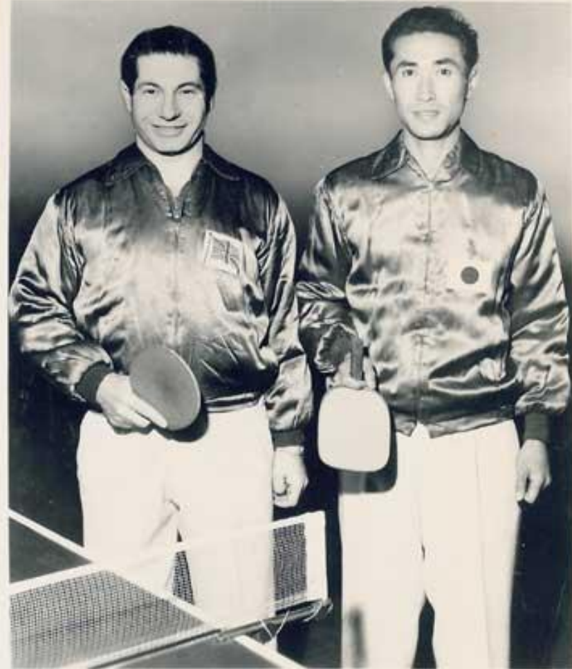
WORLD TABLE TENNIS CHAMPIONS