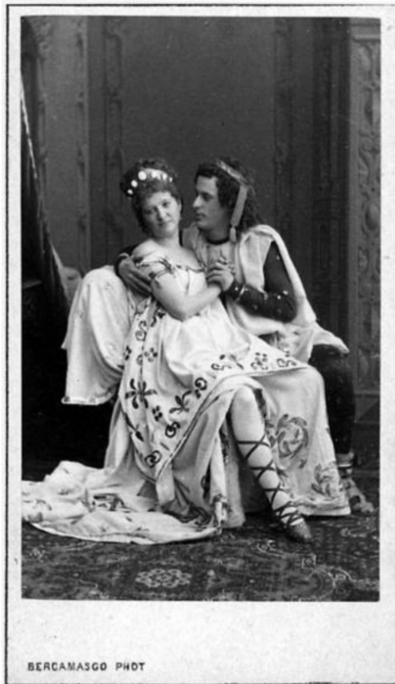
Спектакль «Прекрасная Елена» в Александринском театре (1870-е).

В XIX веке русский театр постепенно становится выразителем исключительно российских социально-общественных идей. Новые поколения драматургов, режиссеров, актеров уже целиком сосредотачиваются на истории и социальных явлениях России. Игра актеров еще оставалась искусственно напыщенной и мало соответствовала нынешним представлениям о театральной культуре. Однако время потребовало реформ в этой области.