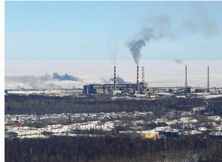
БЦБК загрязняет воду и атмосферу Прибайкалья

В 1996 году Байкал был внесён в Список объектов Всемирного наследия ЮНЕСКО.