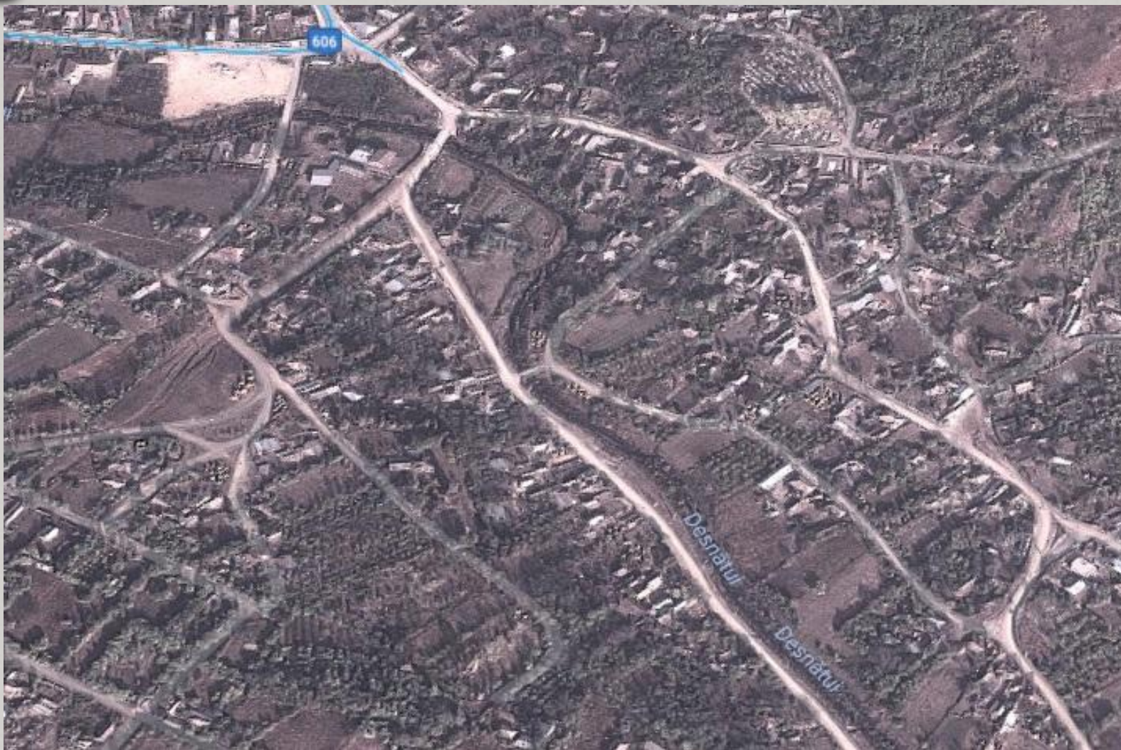
Клянов - Румыния. Население - 1648 чел. «Плохой» посёлок.