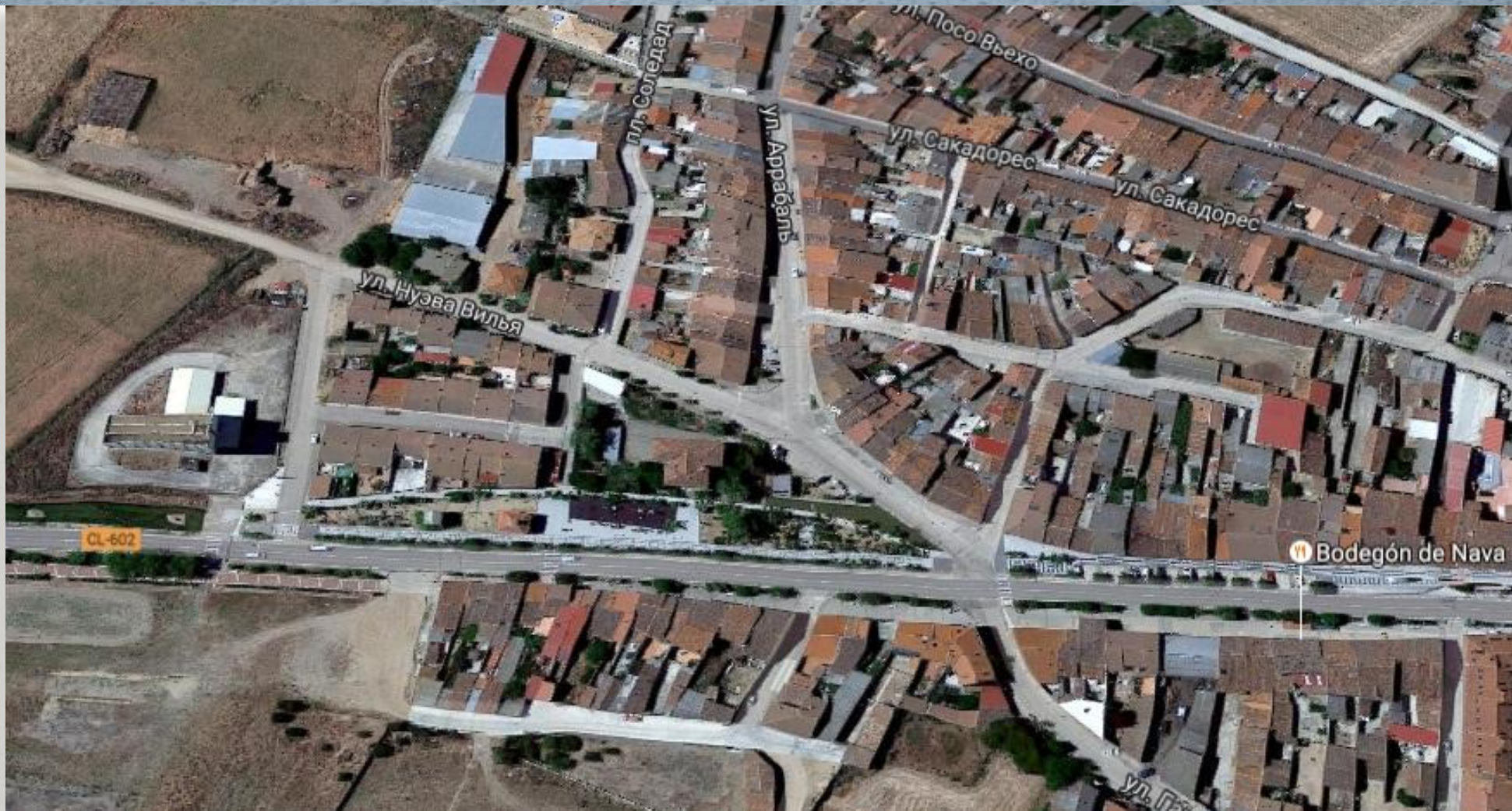
Нова-дель-Рей – Испания. Население – 2123 чел. «Плохой» посёлок.