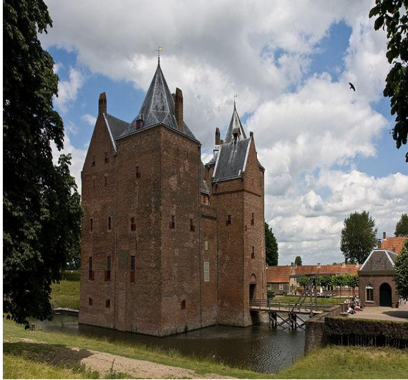
Więzienie Loevenstein (1619-21)